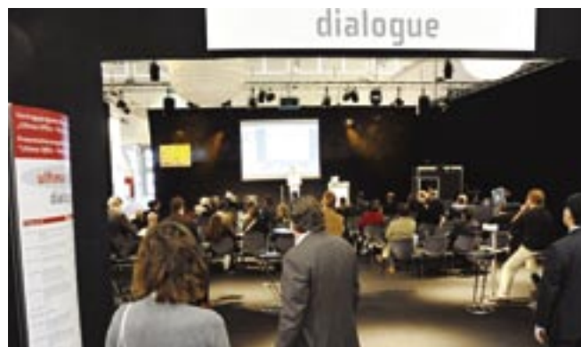
Der kollektive Think Tank zeichnete ein differenziertes Bild möglicher Zukunftsentwicklungen.

Zukunftsvisionen in persönlichen Videostatements. Hier wurde besonders oft der Wunsch nach offenen Räumen geäußert. Solche Open Spaces sollten nach Vorstellung der Orgatec-Besucher viele unterschiedliche Zonen wie Arbeitsbereiche, Kommunikations- und Kaffee-Ecken, Sport- oder sogar Schlafbereiche bieten. Auch naturnahe Büros mit vielen Pflanzen, Verbindung zur Natur oder mit Außenbereichen für die Arbeit im Freien stehen auf der Wunschliste weit oben, genauso wie nachhaltige und gesundheitsförderliche Büros. Viele Teilnehmer wünschten sich außerdem Büros mit Wohnzimmeratmosphäre, bei denen Wohlfühlen und Gemütlichkeit groß geschrieben