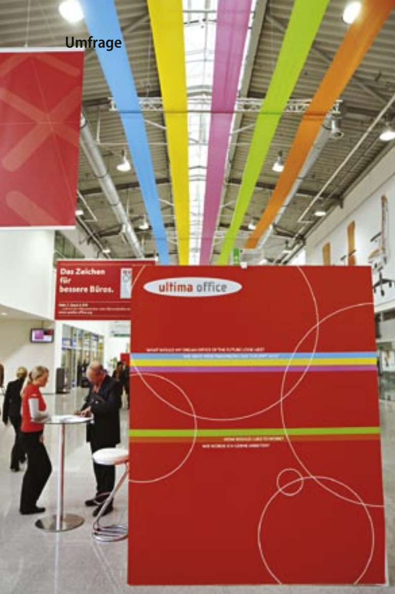
Die bisher größte Umfrage zum Büro von morgen fand auf der Orgatec 2008 in Köln statt.