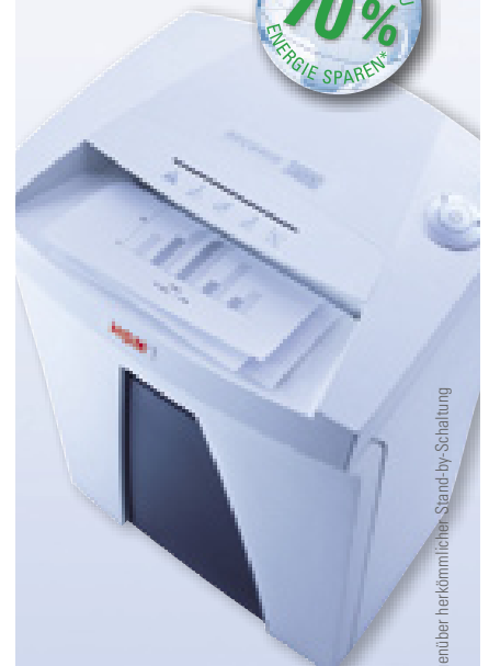
* Gegenüber herkömmlicher Stand-by-Schaltung